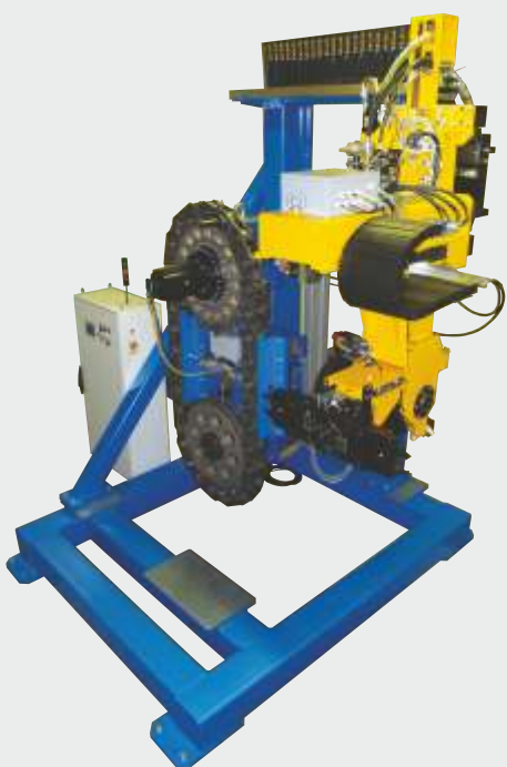
VÝMĚNY NÁSTROJŮ PRO OBRÁBĚCÍ STROJE